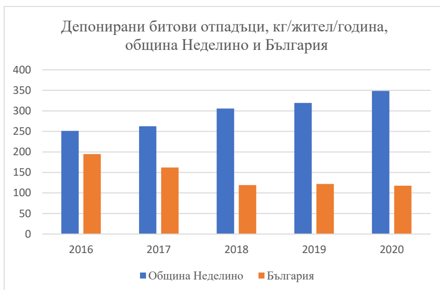
Фигура 4. Депонирани битови отпадъци в община Неделино и България за периода 2016-2020 г. (кг/жител/година)

По данни от Община Неделино до момента не е създадена организация за разделно събиране на отпадъци от опаковки към източника на образуване – домакинства, административни сгради, търговски обекти и др. стопански субекти. Населението на общината е около 5200 души. Разпоредбата на чл.19, ал.3, т.11 не задължава общината да въвежда система за разделно събиране на битовите отпадъци. Цялото количество генерирани отпадъци се транспортира до Регионално депо - Мадан до инсталацията за предварително третиране. След като се отделят оползотворимите фракции като хартия, стъкло, пластмаса и цветни метали, останалият неоползотворим отпадък се депонира на клетка за депониране на същото депо.