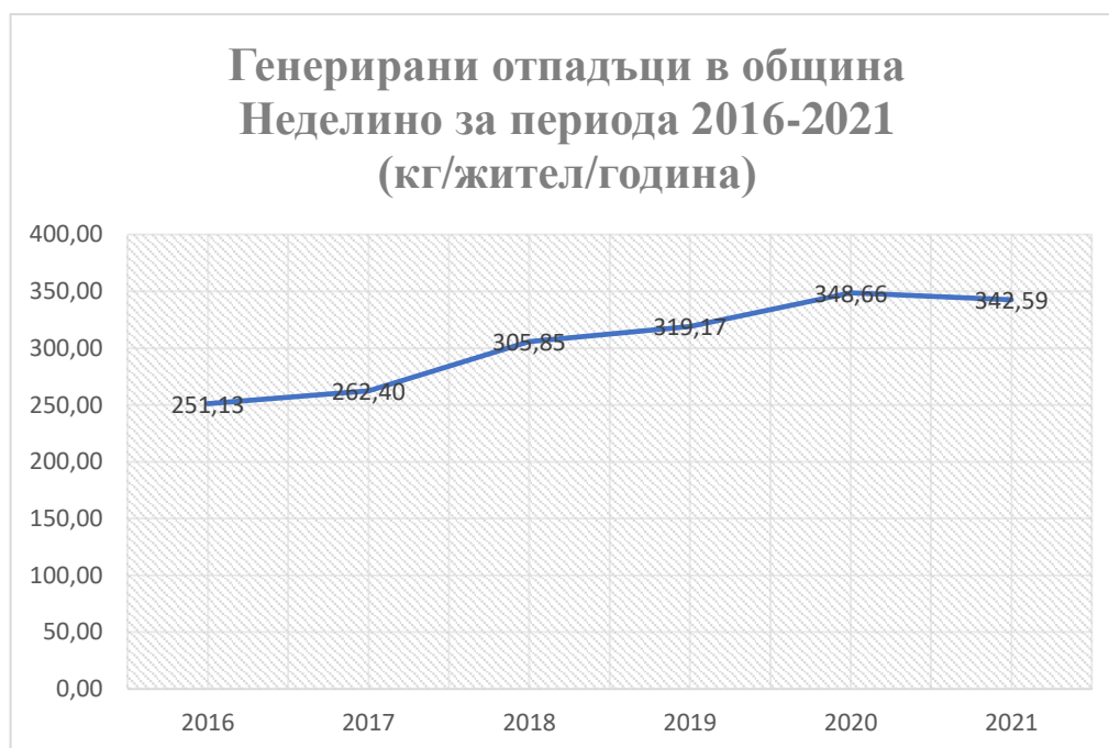
Фигура 2. Образуваните битови отпадъци в община Неделино за периода 2016-2021 г. (кг/жител/година)

Въз основа на отчетените количества на битовите отпадъци, са изчислени и нормите на натрупване за периода 2016-2021 г. (Фигура 2).