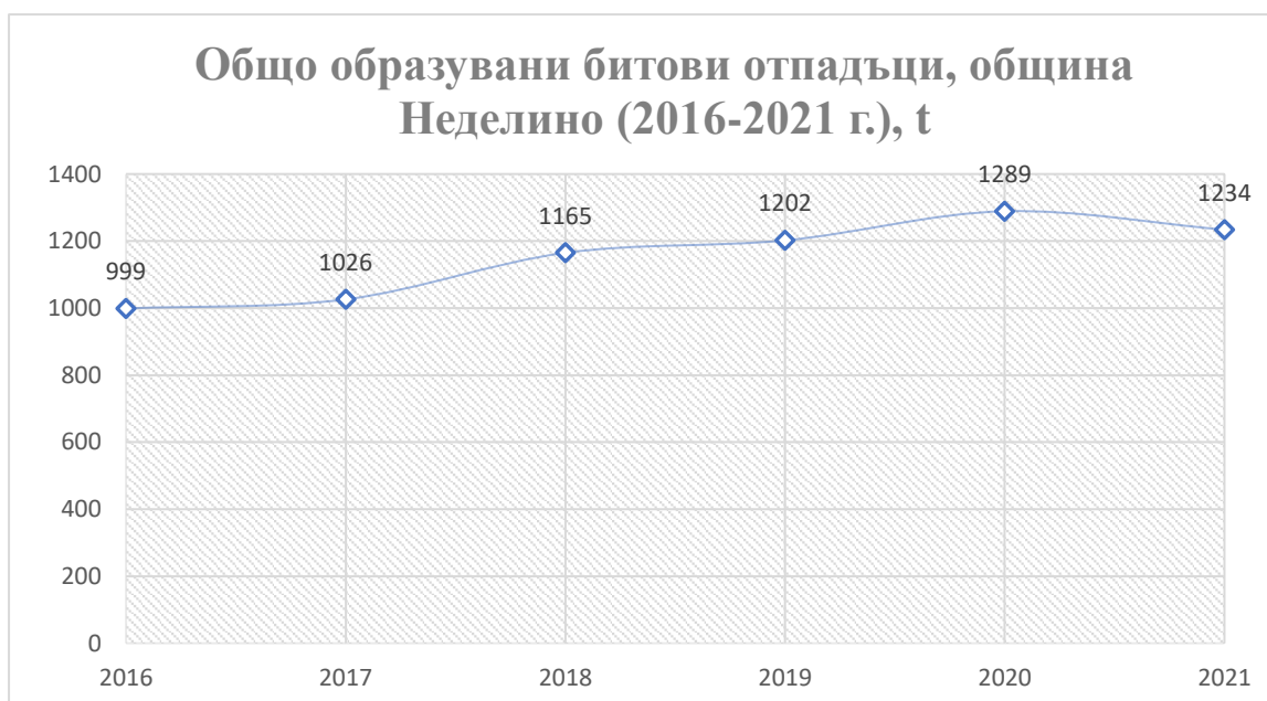
Фигура 1. Общо образувани битови отпадъци, община Неделино (2016-2021 г.), t

За територията на община Неделино по време на периода 2016-2021 г. се наблюдава тенденция към увеличение на количеството генерирани отпадъци до 2020г., след което следва леко намаляване през 2021г. (Фигура 1).